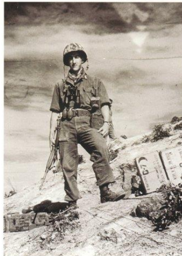
Un sergent du Bataillon français de l'ONU en Corée en 1953.