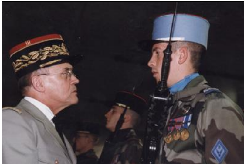
Texte de l'éditorial du Général MERCIER