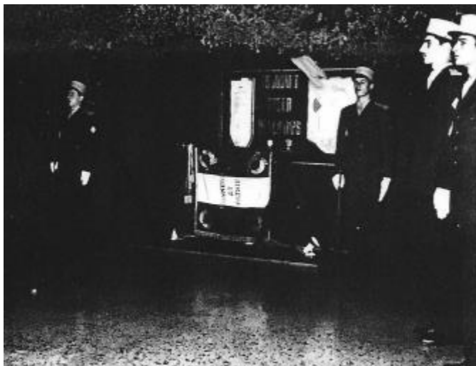
Veillée d'armes autour du Drapeau de l'École.

Le 18 matin, après la messe de promotion célébrée en l'Abbatiale par le Père de LOURDES, aumônier de l'École, il est 11 h 00 quand le Colonel LEMAIRE, accompagné par le Général VAILLANT, se présente devant le front des troupes et passe en revue l'imposant dispositif des 4 Bataillons d'élèves et de la Compagnie École dans un « présentez armes » impeccable malgré la bise qui engourdit les doigts et griffe les visages.